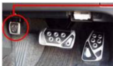
腳煞車 Foot parking brake :